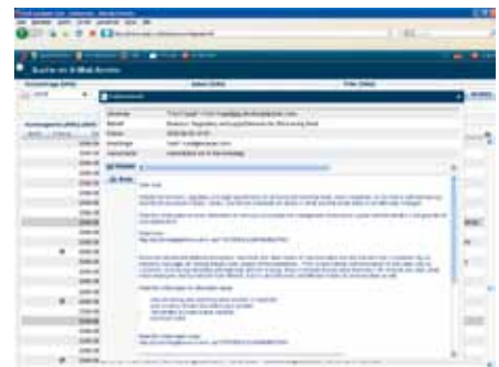
Detailansicht einer archivierten E-Mail in der benutzereigenen Suchmaske

Das Archiv kann auf einmal beschreibbare Datenträger ausgelagert werden. Sobald genug Daten zum Füllen eines Datenträgers angefallen sind, wird dem Administrator ein ISO-Image angeboten, das er zur weiteren revisions sicheren Lagerung auf CD, DVD oder Blu-ray Disc brennen kann.